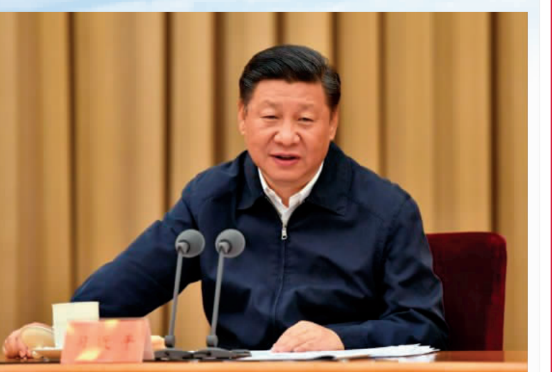
图1 习近平在中央财经领导小组会议上发表重要讲话

金融是国之重器，是融资本管理，完善外汇市场体制机制。要完善现代金融企业制度，完善公司法人治理结构，优化股权结构，建立有效的激励约束机制，强化风险内控机制建设，加强外部市场约束。